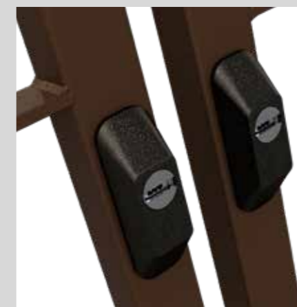
Defender esterno per cilindro passante External Defender for passing cylinder

The distinguishing feature of the "Edilia 2" security bar system is its streamlined structure. The security bar system consists of a perimeter frame in galvanized steel with a 30x30 mm section and 2 mm thick. The perimeter frames are available in 7 different versions to offer the most suitable opening for your needs. Its particular structure leads to an overall size of just 35mm, allowing its use even in presence of mono-blocks with no need to make changes to existing windows.