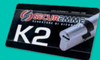
Tesserina di duplicazione chiavi Duplication keys card