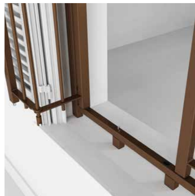
Posizione: Apertura totale esterna Position: Total external opening

La caratteristica della grata "Edilia 2" è la struttura resa semplificata. La grata è realizzata da un telaio perimetrale di acciaio zincato di sezione 30x30x2 mm di spessore. I telai perimetrali sono disponibili in 7 diverse tipologie, per offrire l'apertura più adatta alle proprie esigenze. La particolare conformazione della grata determina un ingombro complessivo di soli 35mm, permettendo l'applicazione anche in presenza di monoblocchi evitando modifiche ad infissi esistenti.