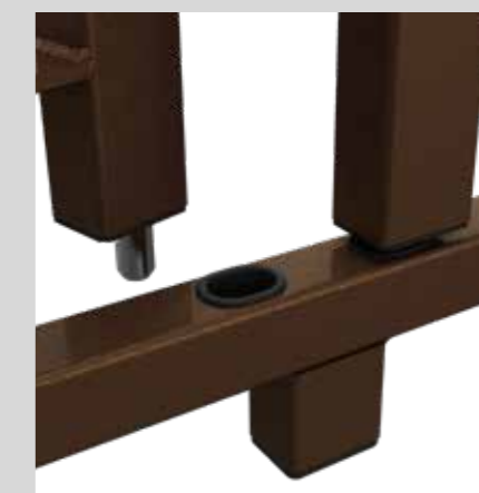
Puntale di chiusura superiore/inferiore Closure tip upper/lower