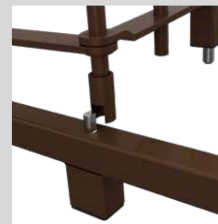
Particolare snodo Hinge detail