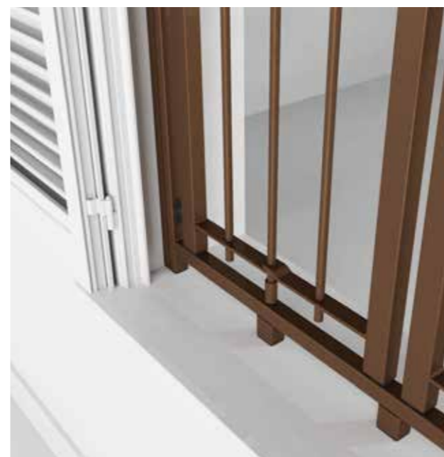
Posizione: Chiusa Position: Closed

The ACS 180 versions are equipped with a special articulated joint, which has a twofold function, in the opening stage, it overturns the panel completely towards the exterior, in the closing stage it locks itself with the frame through a carbonitrided steel pin and it also offers anti-rip out anchorage points. Thanks to its articulated joint allows obtaining a complete opening also towards the interior of the room, making opening window bolt of the shutter or large panel, easier.