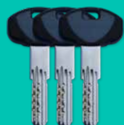
3 chiavi padronali 3 keys