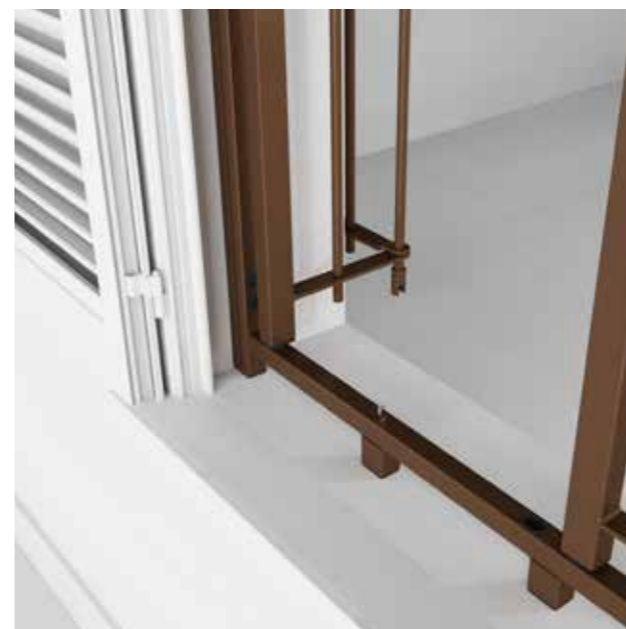
Posizione: Apertura totale interna Position: Total internal opening